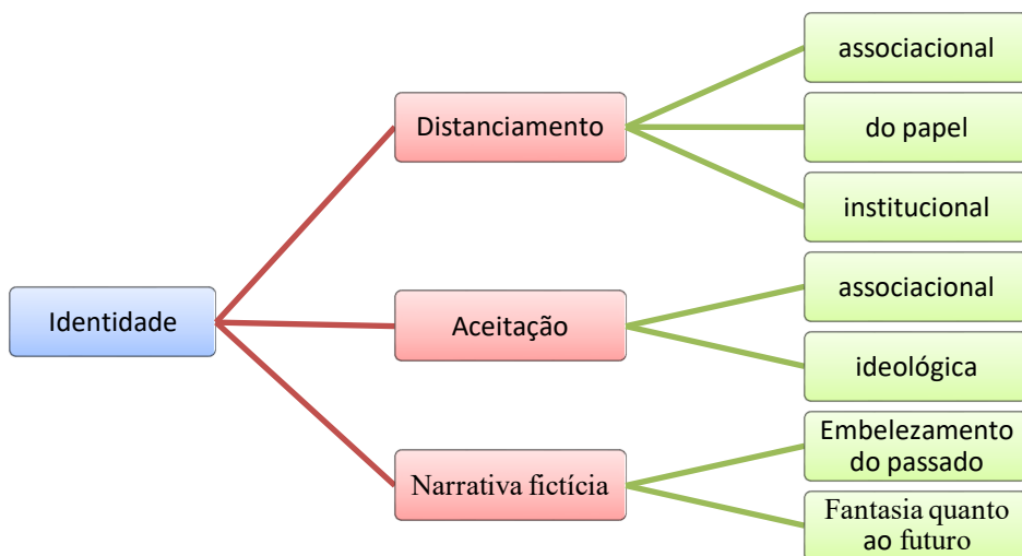
Figura 3 - Identidade