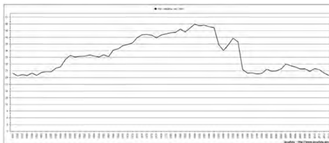
Gráfico 1 - Participação da indústria no PIB - série histórica (1947-2013):

Fonte: Portal eletrônico do Instituto de Pesquisa Econômica Aplicada (Ipea). Endereço: http://www.ipeadata.gov.br/ acesso em 21 de maio de 2018.